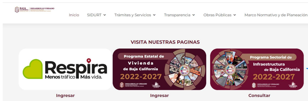
Figura 3. Página Oficial SIDURT, Programa Sectorial.